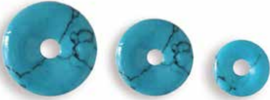
IMITAZIONE TURCHESE MATRIX